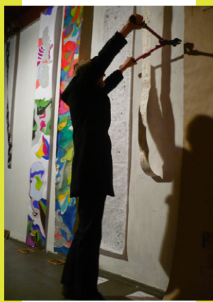
Spy & Win

„Musik verbindet“ vom Konservatorium für Türkische Musik: Türkische Musikgruppen und Berliner Nachwuchskünstler bieten in ihren Konzerten türkische