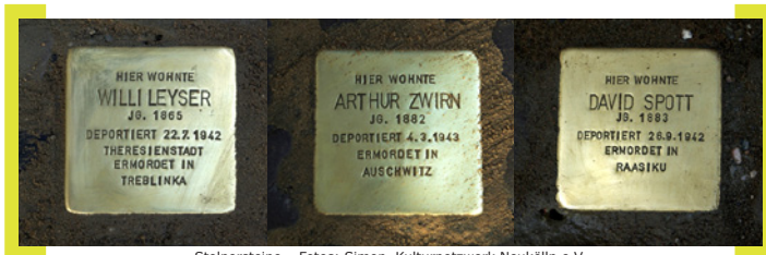
Stolpersteine – Fotos: Simon, Kulturnetzwerk Neukölln e.V.

-> Weitere Infos unter www.kultur-neukoelln.de