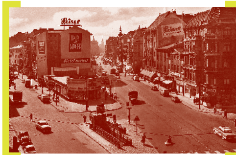
Impressionen aus dem Buch „Die Karl-Marx-Straße – Facetten eines Lebens- und Arbeitsraums“ von Cornelia Hüge