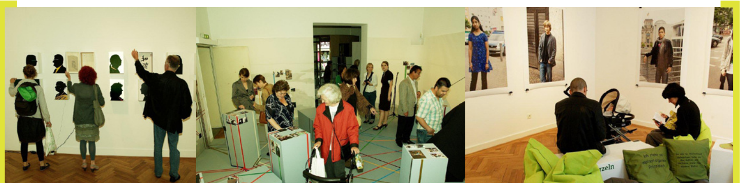
Impressionen aus der Ausstellung „Weltbürger“