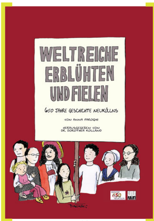
Cover zum Neukölln-Comic

die Möglichkeiten der digitalen Medien exzellent nutzt. Als letzten Akt der 650-Jahr-Feier werden wir am 11. Dezember 2010 um 11 Uhr zu einem nachdenklichen Spaziergang entlang der Karl-Marx-Straße aufbrechen und uns um 12 Uhr