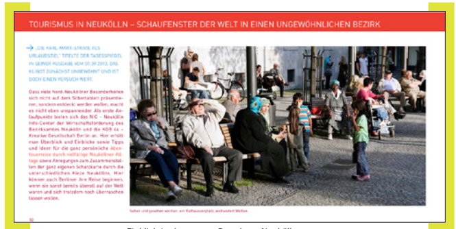
Einblick in den neuen Broadway Neukölln

Auf dem Late Light Shopping-Stand der [Aktion! Karl-Marx-Straße] auf dem Rathausvorplatz können Sie auch noch eines der letzten Exemplare des „Broadway Neukölln 2“ erhalten. Gratis. Oder im NIC im Haupteingang des Rathauses. Oder zum Download unter www.Aktion-KMS.de .