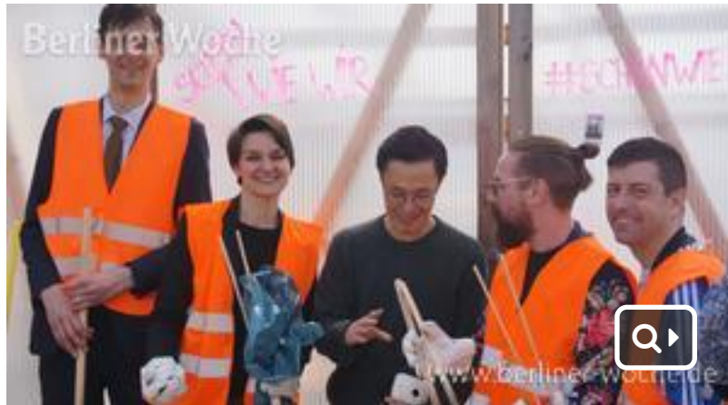
Bürgermeister Martin Hikel (l.) mit einigen der Unterstützer vom Kindl-Gelände.

„Wir können es nicht alleine schaffen, aber wir können eine Plattform bieten“, sagte Bürgermeister Martin Hikel (SPD), als er am 4. April auf dem Kindl-Gelände den Startschuss zum großen Frühjahrsputz gab. Er war freudig überrascht, wie viele Menschen mit ihm gemeinsam zu Besen und Mülltüten griffen.