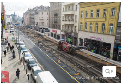
Blick auf die Baustelle, ganz hinten liegt der Eingang zur U-Bahnstation Karl-Marx-Straße.

Der zweite Abschnitt der Mammut-Baustelle auf Neuköllns Einkaufsmeile nähert sich seinem Ende. Momentan gibt es allerdings eine Pause. Darüber informierte nun die „Aktion! Karl-Marx-Straße“.