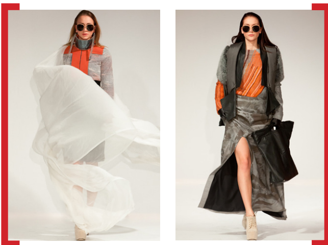
Design 14twenty6 beim Designercasting im Concept Store Neukölln

Wirtschaftsförderung und dem Citymanagement statt. Die Örtlichkeit Ganghoferstraße 2, die vom Citymanagement in Kooperation mit NEMONA für zwei Wochen mit Beginn des Late Light Shopping vom 15.11. bis 1.12.12 mit einem Concept Store bespielt wurde, verwandelte sich an einem Abend in eine Spielfläche für das Designercasting. Neben den Neuköllner Labels werden sich zudem die Berliner Label P|AGE, NIX Berlin und UMASAN auf dem SHOWFLOOR BERLIN präsentieren. Internationale Designer und Designerinnen, die außerdem auf dem SHOWFLOOR BERLIN dabei sein werden, sind Johanna Riplinger aus Paris, Göttin des Glücks aus Wien, Somyso aus Zürich sowie Battenberg&Cartwright aus London. Erstmals findet er im Huxley's Neue Welt am Hermannplatz in Neukölln statt. Die neue Location ist Teil eines neuen Konzepts: Neukölln als kreativster Stadtbezirk der Metropole, zieht viele Künstler und Kreative aus In- und Ausland an. Der Bezirk befindet sich im Wandel: Cafés, Galerien, Boutiquen reißen sich zwischen Handyshops, Spätkaufäden und Spielcasinos ein. Das Huxley's Neue Welt bietet traditionelle Räumlichkeiten, welche noch den Charme vergangener Zeiten versprühen. Hier wurde schon seit dem späten 19. Jahrhundert getanzt und gefeiert. Später spielten hier Musiklegenden wie Jimi Hendrix und die Dire Straits.