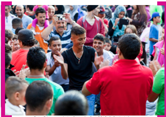
Gute Stimmung beim Ramadanfest 2013

In diesem Jahr wurde das Ramadanfest an der Karl-Marx-Straße zum fünften Mal gefeiert. Am 11. August 2013 luden das DAZ – Deutsch-Arabisches Zentrum für Bildung und Integration und seine 20 türkischen und arabischen Vereine sowie Piranha Kultur und die [Aktion! Karl-Marx-Straße] auf den Karl-Marx-Platz ein. Geboten wurden traditionelle und moderne Musik, ein weit gefächertes kulinarisches Angebot und viele Aktivitäten für Kinder. Der Karl-Marx-Platz füllte sich bei strahlendem Sonnenschein schnell und die Gäste feierten bis in den Abend hinein. Im kommenden Jahr findet das Ramadanfest auf dem dann umgebauten Platz der Stadt Hof statt und es wächst hoffentlich weiter, zieht neue Gäste und neue Unterstützer an.