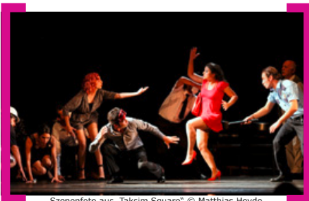
Szenenfoto aus „Taksim Square“

Die Karl-Marx-Strasse als Festivalmeile: 15 Produktionen aus 13 Nationen zwischen Oper und Ritualshow. Sieben Tage zeigte die Neuköllner Oper, wie vielfältig Musiktheater sein kann, auch wenn es durch die politische wie ökonomische Krise in Europa bedingt unter schwierigsten Verhältnissen entstehen musste: Wie bei der „Zauberflöte“ – ohne Orchester, nur von sechs Sängerdarstellern aufgeführt, die mit ihrer Version von Mozarts bekanntester Oper begeisterten. Oder bei dem Musical „Taksim Square“ über den Aufstand in der Türkei, das ein Theater aus Istanbul vor vielen türkischstämmigen Zuschauern zur Uraufführung brachte. Für die Berliner Zeitung war klar: Mit Werken wie dem Musikantanztheater