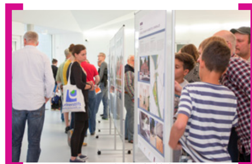
Neugierig werden die Infotafeln für den Gebietsteil Sonnenallee betrachtet

In der Quartierssporthalle auf dem Campus Rütli wurde am 26. August 2013 das Beteiligungsgremium Sonnenallee neu gewählt. Rund 100 Interessierte hatten sich am Abend zusammengefunden, um sich über die aktuellen Entwicklungen im Gebietsteil des Aktiven Zentrums und Sanierungsgebietes zu informieren. Die Planungen für den Lohmühlen- und Weichselplatz wurden diskutiert und ein neues Beteiligungsgremium gewählt. Die nun gewählten acht Mitglieder sind im Gebietsteil Sonnenallee wohnhaft, besitzen dort Eigentum oder arbeiten dort. Sie wollen die Bedürfnisse und Interessen der im Sanierungsgebiet „betroffenen“ Menschen vertreten. Die Internetseite des Beteiligungsgremiums finden Sie hier —> www.aktionsonnenallee.de