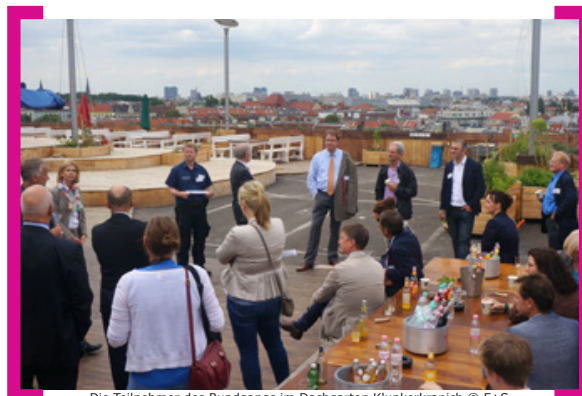
Die Teilnehmer des Rundgangs im Dachgarten Klunkerkranich