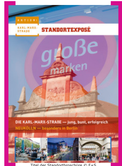
Titel der Standortbroschüre

Pünktlich zum Investorenrundgang im August 2013 erschien ein Standortexposé für die Karl-Marx-Straße. Interessierte Immobilienentwickler und Investoren erfahren hier alle wichtigen Fakten. Die Standortbroschüre ist beim Citymanagement der [Aktion! Karl-Marx-Straße] erhältlich, eine Kurzfassung finden Sie auch im Internet unter —> www.Aktion-KMS.de/projekte/handel/standortbroschuere/