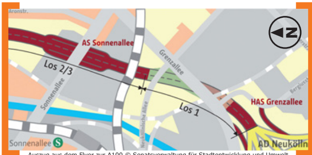
Auszug aus dem Flyer zur A100

Ab dem 24. Februar 2014 treten die Bauarbeiten am 16. Abschnitt der BAB A 100 in die nächste Phase, dann wird die Durchfahrt zur Grenzallee gesperrt und eine umfangreiche Umleitung des Verkehrs eingerichtet. Insbesondere die Sonnenallee wird zur Aufrechterhaltung des Verkehrs als Umleitungsstrecke benötigt. Die Sonnenallee wird auch nach der