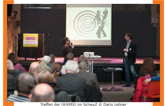
Treffen der [AIKMS] im SchwuZ