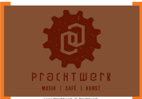
Logo Prachtwerk