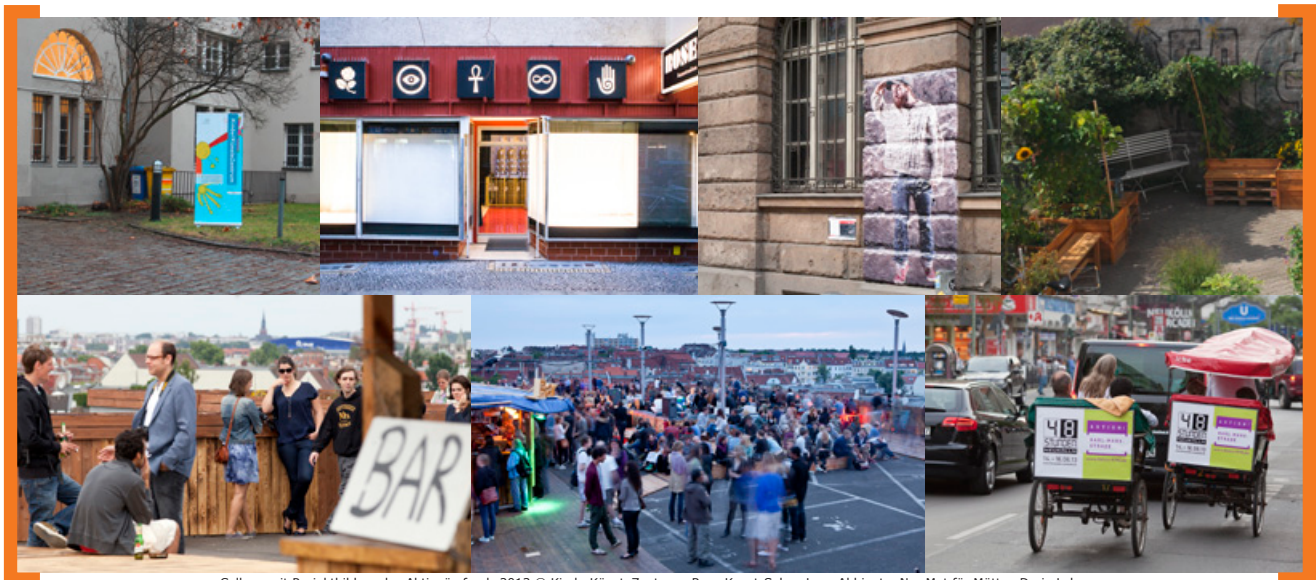
Collage mit Projektbildern des Aktionärsfonds 2013

Wir sehen uns in Neukölln, Ihr Horst Evertz