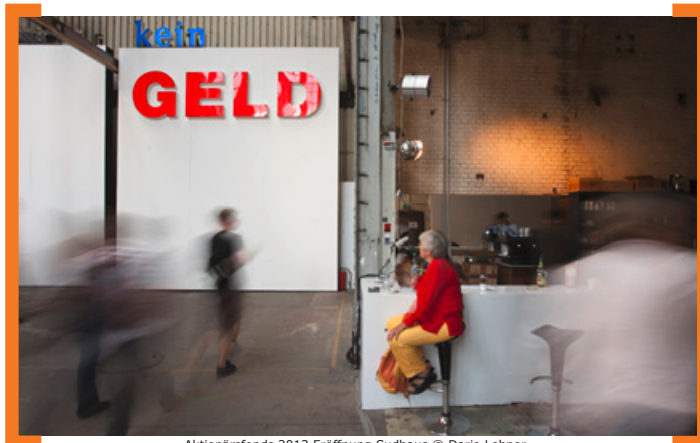
Aktionärsfonds 2013 Eröffnung Sudhaus

Werden Sie Aktionär der Karl-Marx-Straße! Zum 8. Mal legt die [Aktion! Karl-Marx-Straße] im Frühjahr 2014 den Aktionärsfonds auf. Im Laufe des Jahres wird der Platz der Stadt Hof (zukünftig Alfred-Scholz-Platz) fertig gestellt und kann zum Treffpunkt für alle Besucher der Karl-Marx-Straße werden. Die Projekte des Aktionärsfonds 2014 sollen zur Belebung dieser „neuen Mitte“ beitragen und den Platz nicht nur bei der Neuköllner, sondern auch bei der Berliner Bevölkerung bekannter machen. Ihre Ideen sind gefragt. Unter dem Motto „Platz da – Raum für Vielfalt“ werden temporäre Projekte wie z.B. Themenmärkte, Feste und Veranstaltungen gesucht. Auch Maßnahmen, die sich mit Bürgerpartizipation im Rahmen des Umbaus auseinandersetzen, sind denkbar. Im Rahmen der jeweiligen Projekte darf die optische Erscheinung des Platzes für die Dauer des Projektes temporär verändert werden, unzulässig sind jedoch bauliche Eingriffe. Grundsätzlich förderfähig sind aber investive Maßnahmen an Gebäuden und im öffentlichen Raum. Förderfähig sind auch Kooperationen von Gewerbetreibenden oder Eigentümern untereinander und die Vernetzung unterschiedlicher Partner aus den Bereichen Einzelhandel, Dienstleistungen oder Kultur. Gefragt sind Projekte, die einen eindeutigen Bezug zu Neukölln haben.