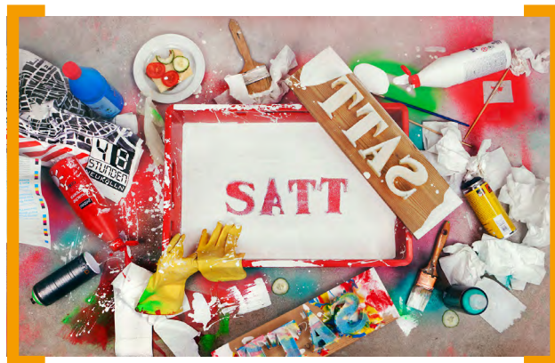
Grafik: Thomas Lehner