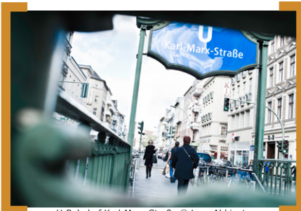
U-Bahnhof Karl-Marx-Straße

Wir hoffen, Ihre Neugierde geweckt zu haben und freuen uns sehr auf Ihr Kommen. → Weitere Informationen zur [Aktion! Karl-Marx-Straße] unter www.Aktion-KMS.de . Die Veranstaltung findet auf Vereinsgelände statt. Bitte melden Sie Sich vor Ort an, hierzu legen wir Listen am Eingang aus.